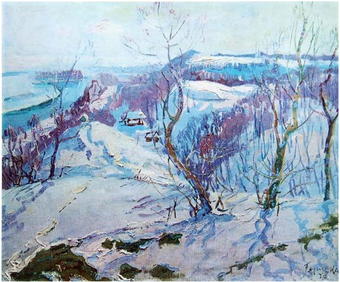
Микола Глущенко, «Зима»